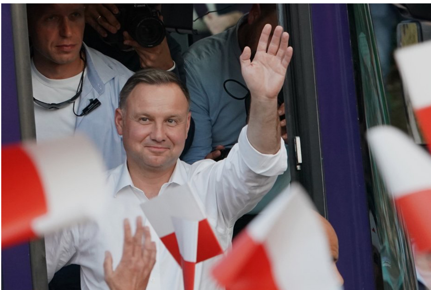
Andrzej Duda op 07/07/2020

De omstreden Poolse partij voor Recht en Rechtvaardigheid (PiS) flikt het alweer: voor de tweede keer op rij wint Andrzej Duda de presidentsverkiezingen met een bijzonder nipte marge.